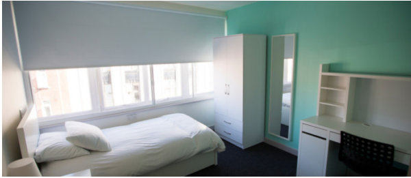
Résidence en centre ville 18+ À partir de 195 € par semaine (selon les dates de votre séjour)