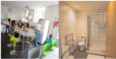
Résidence accessible à partir de 18 ans