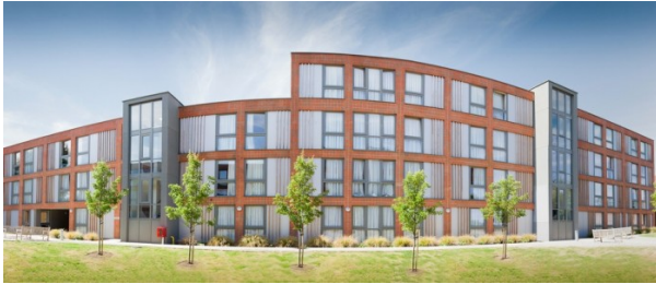
Résidence Wavy Gate (16+)

Les hébergements chez l'habitant se situent dans un rayon de 30 à 40 minutes de l'école par les transports en commun