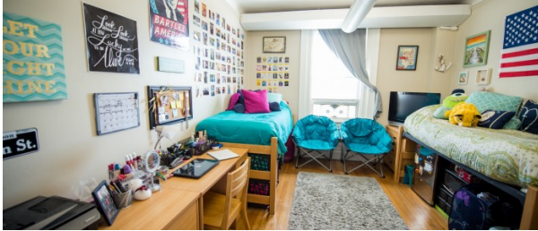
Fisher HI Residence Hostel

À partir de 569 € par semaine (selon les dates de votre séjour)