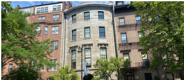
Résidence sur le campus de Fisher College À partir de 624 € par semaine (selon les dates de votre séjour)