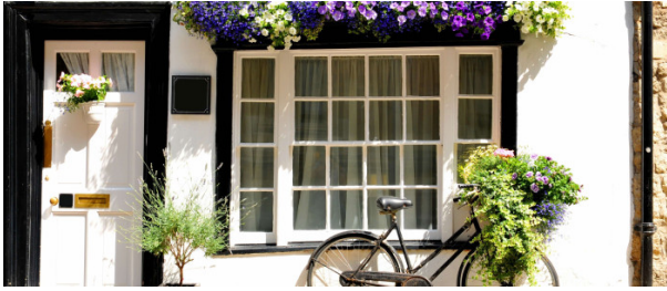
Chambre chez l'habitant

À partir de 335 € par semaine (selon les dates de votre séjour)