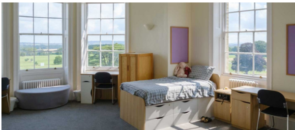
Internat du collège