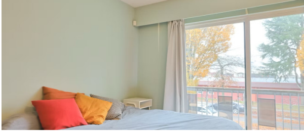
Student House Budget

À partir de 235 € par semaine (selon les dates de votre séjour)