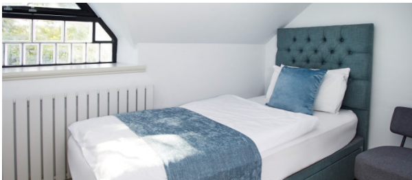
Résidence de l'école

À partir de 322 € par semaine (selon les dates de votre séjour)