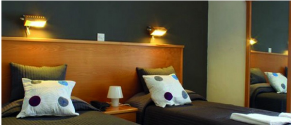
Résidence de l'école

À partir de 510 € par semaine (selon les dates de votre séjour)